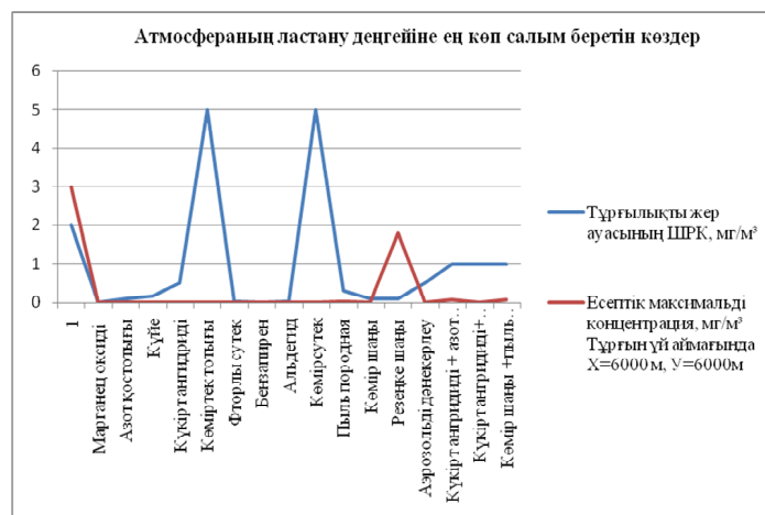
1 сурет. Атмосфераның ластану деңгейіне ең көп салым беретін көздер