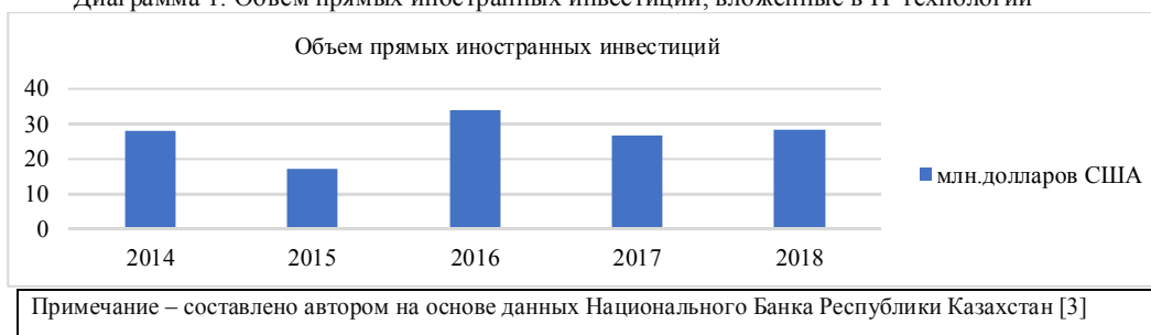
Диаграмма 1. Объем прямых иностранных инвестиций, вложенные в IT технологии

Государственная программа "Цифровой Казахстан-2020" является фундаментом для цифровой трансформации экономики страны. По мере внедрения новых технологий и проникновения их во все новые профессии, требует от всех работников постоянно заниматься над повышением своей квалификации. С учетом сложившейся ситуации стоит необходимость в долгосрочном развитии цифровых навыков по таким направлениям, как: развитие навыков профессиональных кадров; повышение привлекательности новых технологий и науки среди молодежи; развитие цифровых навыков среди всех слоев населения, включая малый и средний бизнес, госслужащих, пожилых; предоставление возможности обучения на протяжении всей жизни. На данной диаграмме 1 представлен объем прямых иностранных инвестиций в новейшие цифровые технологии.