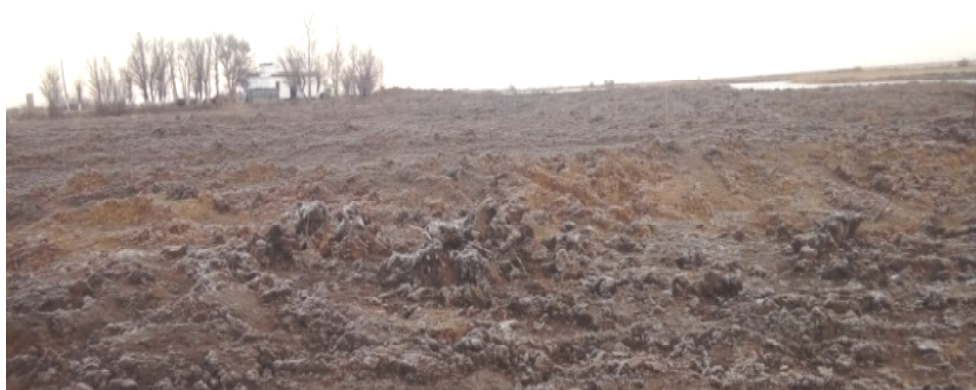
Рисунок 1. Сплавина из озера

Мало кто догадывается, что очищая озеро от растительности, водорослей, торфа и сапропеля (сплавины), он выбрасывает высокоэффективное органо-минеральное удобрение так необходимое сельскому хозяйству. В общей сложности было выкачено со дна озера за период май-октябрь месяц 2018 года 960 тысяч тонн ила и водорослей, которые были отправлены на сельхоз поля.